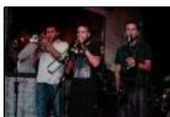
SXSW: Sounds of Uruguay