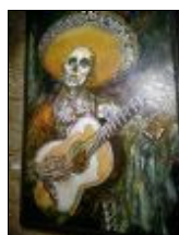
Museo Robert Rodriguez